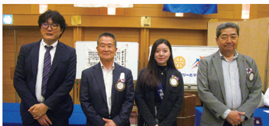
4月誕生日の会員さん (一部)