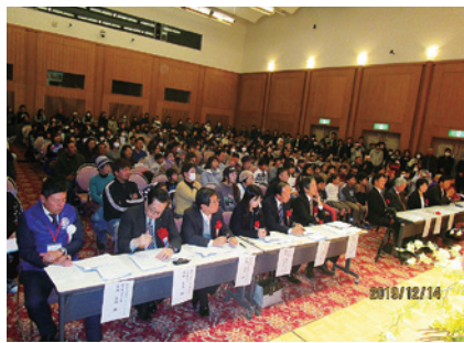
最前列の審査員の皆様