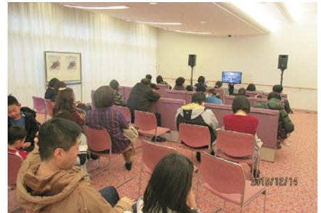
テレビモニターも設置