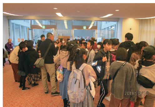
会場前には出場者と父兄で溢れる!