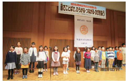
可愛い小学生の群読発表!