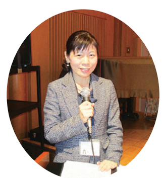
(午前)司会進行の市教委の先生