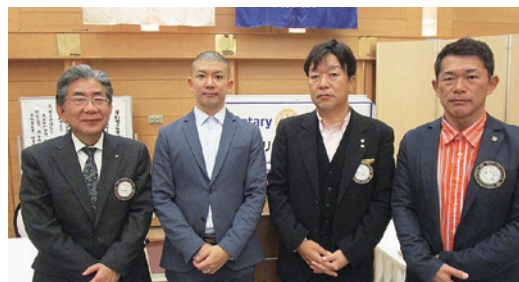
講師の先生を囲んで (左) 柏原プログラム委員長 (右) 東幹事

これからも観光を通じて高野山来訪者へ、和歌山が誇る偉人・空海が遺した言葉を世界に伝える一助となり、訪れる方々の更なる満足度向上につとめていければと考えております。