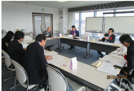
別室での審査風景