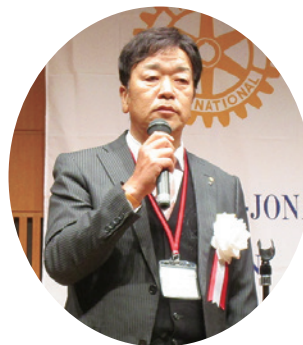
曾和会長の開会挨拶