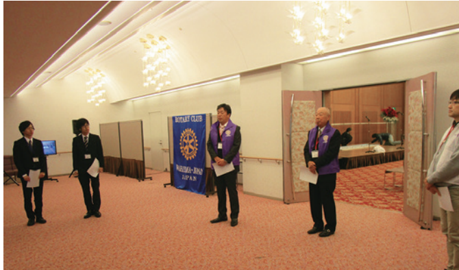
開会前の打ち合わせ