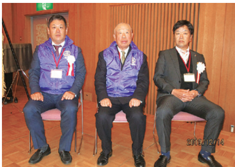
(左)堂西社会奉仕委員長、浦青少年奉仕委員長