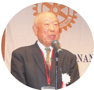
浦青少年奉仕委員長の閉会挨拶