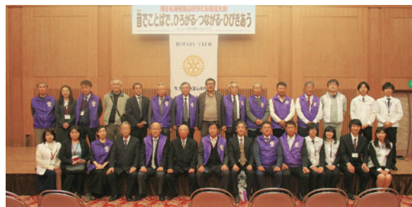
ボランティアの和大学生さんと記念写真(参加者一部)