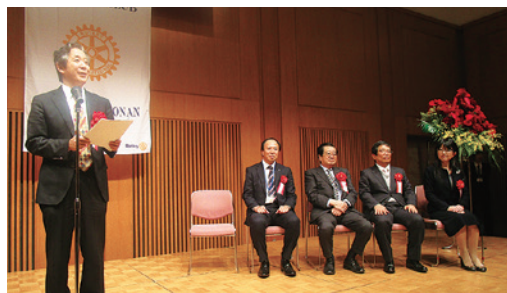
審査員の先生方お疲れ様でした