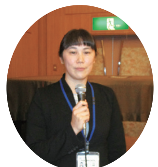
(午後)司会進行の市教委の先生