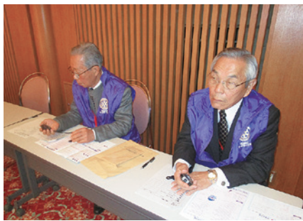
タイムキーパーの会員さん(一部)