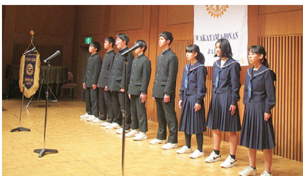
中学生の群読発表