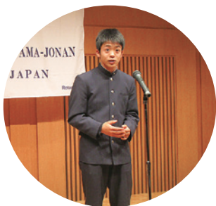
(個人の部)見事な中学生の発表!