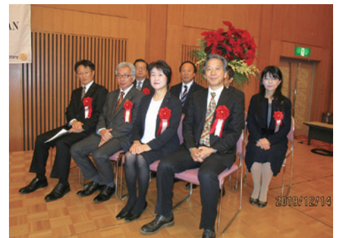
来賓、審査員の皆様方