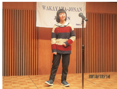
(個人の部)小学生の最優秀賞の披露