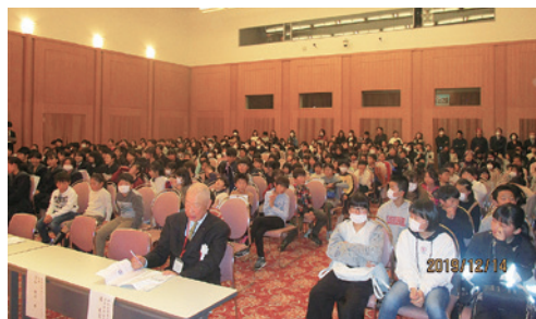
審査発表前の緊迫した会場風景