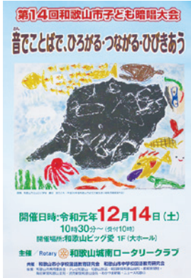
会場入口のポスター

12月14日(日)、10時30分より和歌山ビッグ愛大ホールにて恒例の当クラブ社会奉仕事業の「第14回和歌山市子ども暗唱大会」が開催された。市内の中学生59名、小学生113名が参加してそれぞれ群読部門、個人部門に分かれて熱気溢れる暗唱大会が繰り広げられた。審査結果を待つ間、サクスライブのアトラクションで楽しんだ後、審査発表と表彰式が行われ、最優秀賞2組の発表が堂々と披露された。大会のお世話を頂いた市教委、審査員、和歌山教育大学の皆様、会員の方々大変お疲れ様でした。