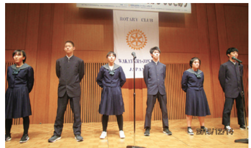
(群読の部)中学生の最優秀賞の披露